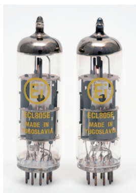
Ei 製 Ei Elites ECL805E (6GV8 互換) のマッチドペアが付属します。