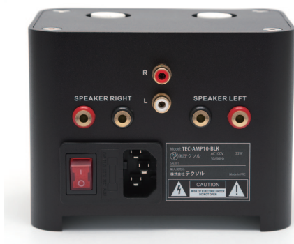
入力は RCA ジャック (2ch)1 系統。出力端子はバナナプラグ専用となっています。